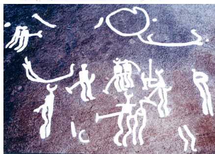
I hovet i Vi utfördes det som var heligt i "den forna seden". Tolkning av Sparlösastenen framställning av Uppsalahovet, av Lucas Wase, och helig orgie, hällristning i Kalleby, Tanum.